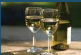
150 میلی لیتر (5 اونس) شراب