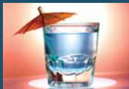
50 میلی لیتر (1.5 اونس) کوکتل