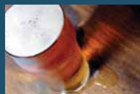
350 میلی لیتر (12 اونس) آجو